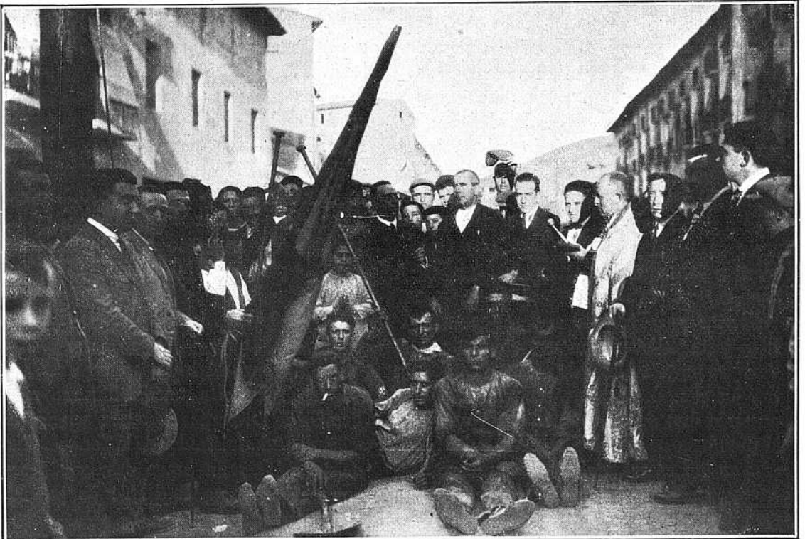
En el acto de la bendición, mézclanse en apretado grupo los obreros de la brigada, el sacerdote revestido y el entusiasta vecindario.

Así se hace patria y se labora por la fraternidad nacional.