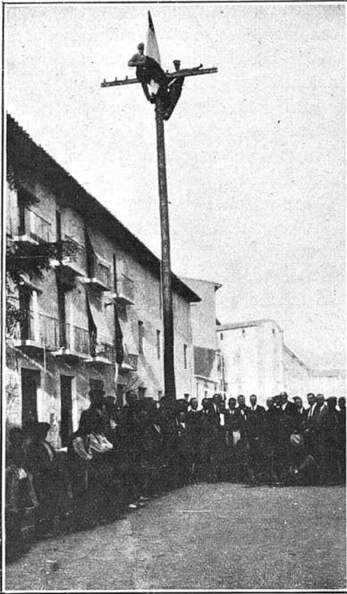
Las autoridades y vecinos de Fraga en torno al primer poste de la línea Fraga=Lérida. En lo alto del mástil se agita la bandera como saludando a la lejanía que más tarde recorrerá la voz.