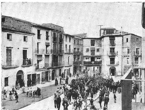
A primeras horas de la mañana el público reunióse ya ante la nueva estación telefónica, adornada con banderas y el triunfal escudo de la Compañía.