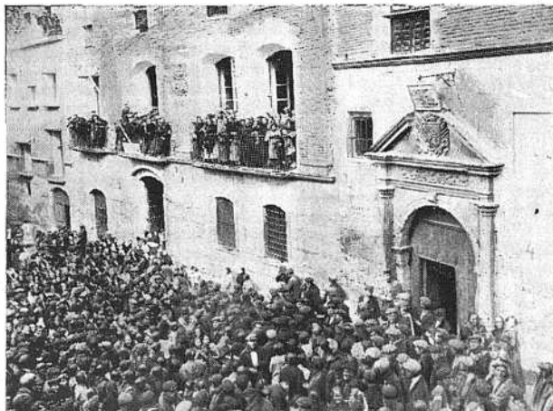
El pueblo, congregado ante el Municipio de Fraga, ovacionando la entrada de los representantes de la Compañía en el momento en que éstos eran recibidos por el alcalde.

El ilustrísimo obispo, vestido de pontifical, bendijo la nueva estación y pronunció un breve discurso encomiando en nombre de la Iglesia la labor de la ciencia. El subdirector del segundo Distrito agradeció en nombre de la Compañía la bendición episcopal y declaró abierto al servi-