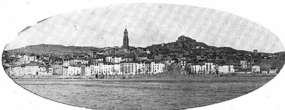
Vista general de Fraga.