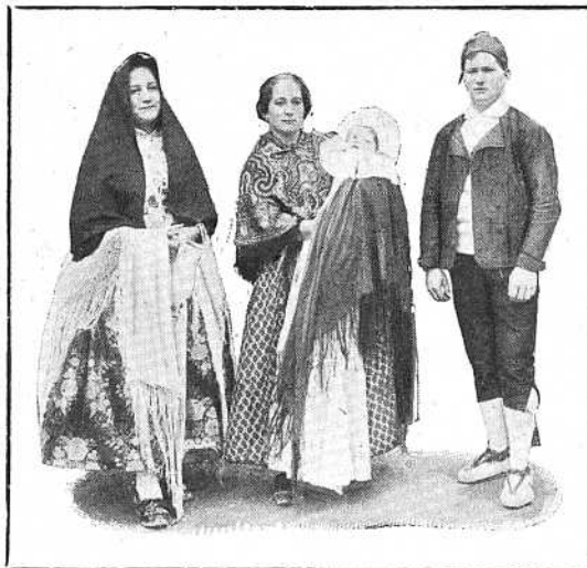
Un bautizo típico, que se presentó en la manifestación artística organizada por la Compañía.

Y así termina una jornada que fué de gloria para la Compañía Telefónica Nacional de España y de provecho para la Nación.