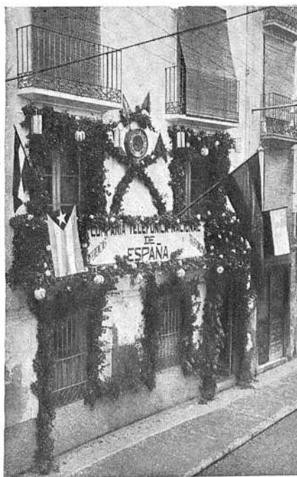
Fachada de la Central de Teléfonos de Barbastro.

Al llegar a Fraga, cerca de las diez de la mañana, todo el pueblo estaba congregado a la entrada del mismo, recibiendo con aplausos y vítores a los recién llegados. El Ayuntamiento estaba representado