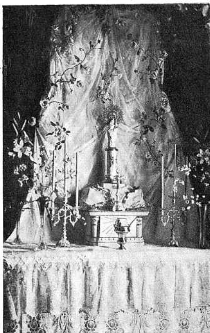
Altar con que fué adornado el interior de la Central Telefónica de Barbastro y ante el cual ofició el obispo de aquella diócesis, bendiciendo la inauguración de la nueva Central.

Tras este acto la comitiva oficial dirigióse al centro telefónico, que fué bendecido e inaugurado con toda solemnidad. En la central telefónica habíase levantado un precioso altar en el que figu-